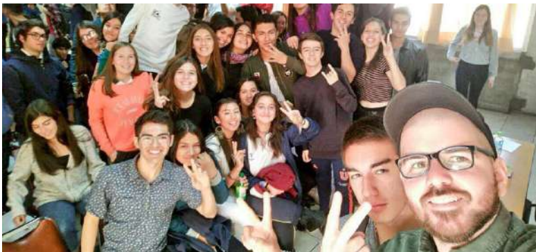
60 jóvenes hablaron con él de la labor legislativa y Educación Pública

En la sede de la Junta de Vecinos Villa Olímpica, funciona de martes a jueves AM, la Escuela Amaranta Gómez (Fundación Selenna). Esta escuela gratuita atiende actualmente a 18 niños transgénero que han desertado del sistema escolar tradicional, por problemas por este tema. La escuela está enfocada en la preparación de exámenes libres de todas las asignaturas, además de talleres como formación ciudadana, yoga, programación y ciencias. Dirección: Sócrates 1236, Ñuñoa